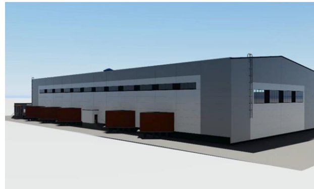
Складские помещения (складской корпус и бытовой блок)